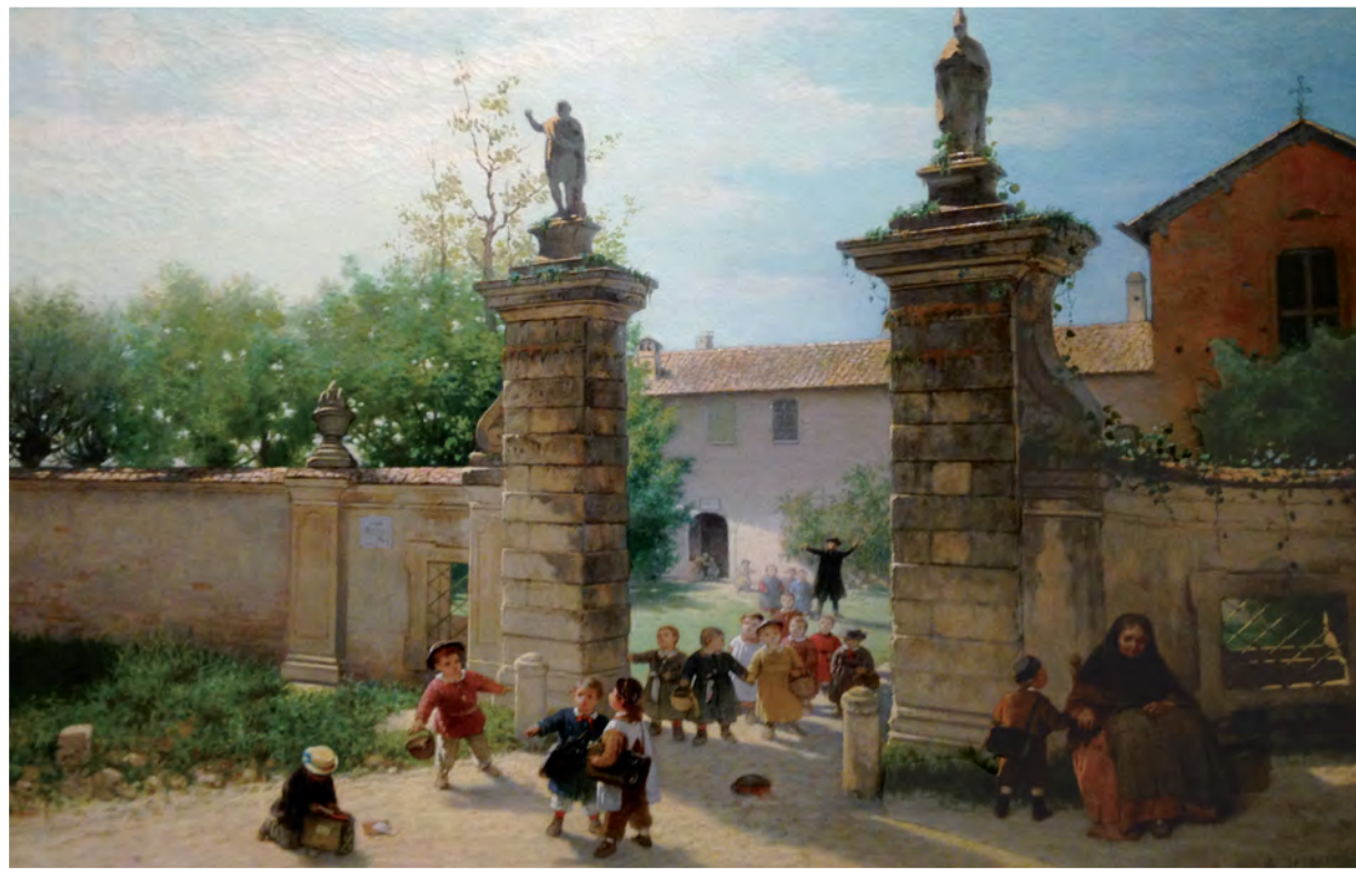
"La passeggiata del giovedì (Il Fopponino)" Angelo Trezzini 1869 - Gallerie d'Italia - Milano